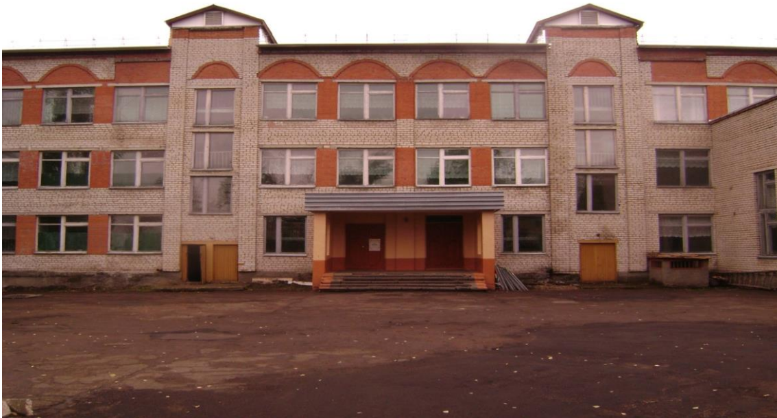
11.Кочуровская средняя школа