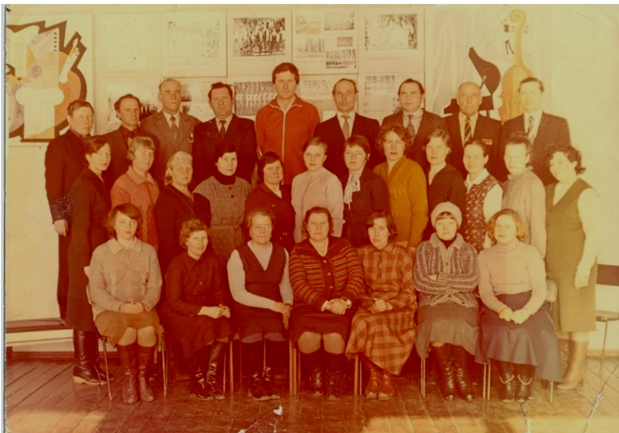
9. Педагогический коллектив, 1982 год