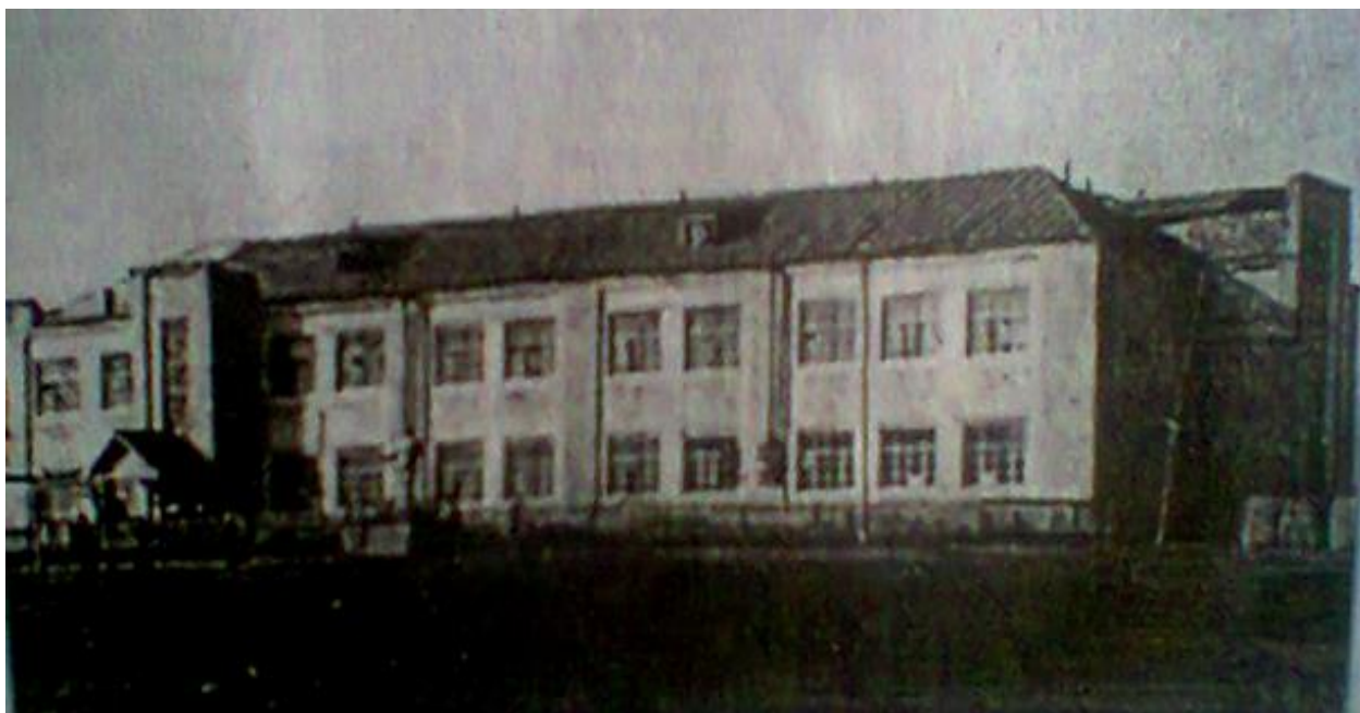
2. Школа, построенная в 1935 году