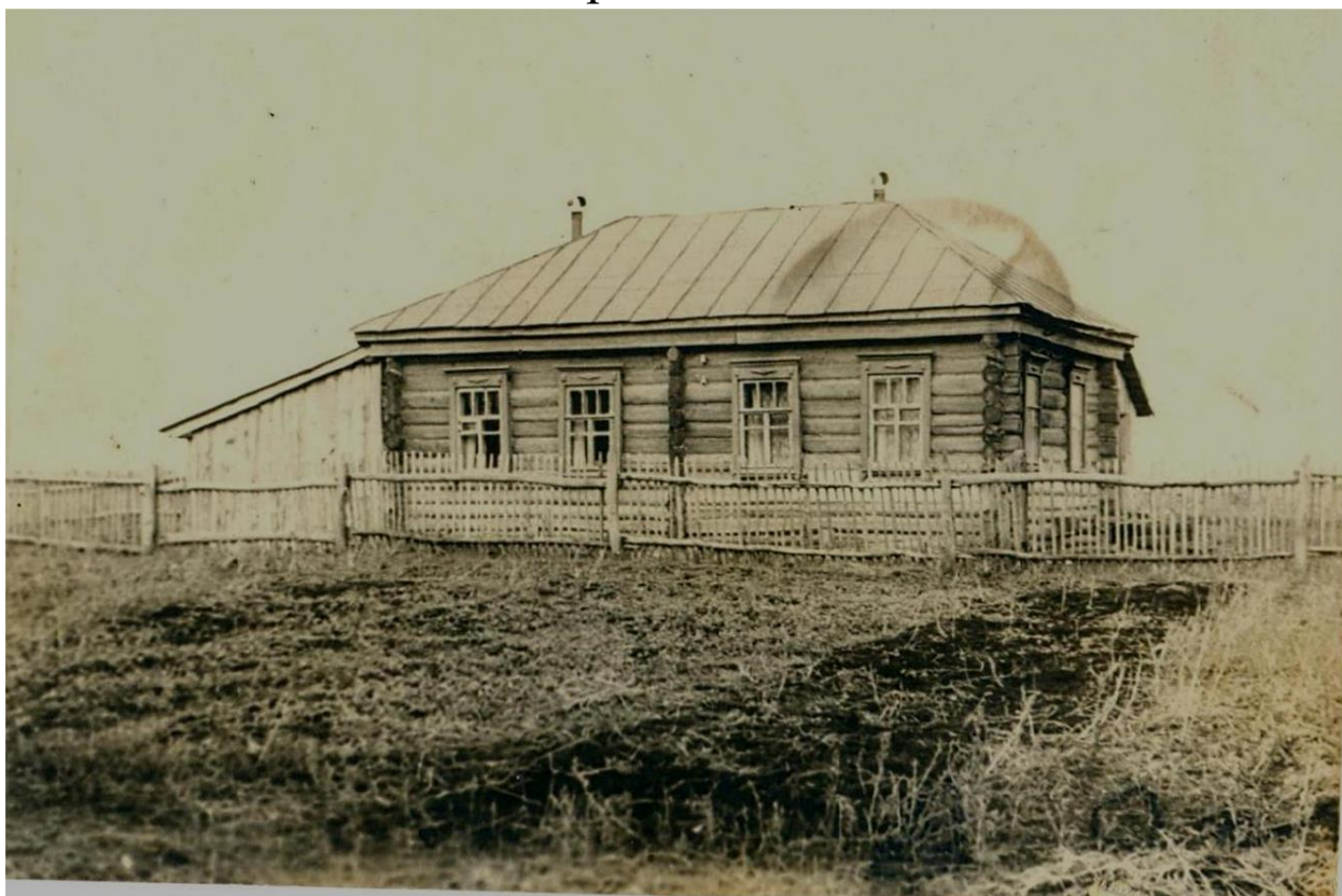
1. Пенькозаводская начальная школа